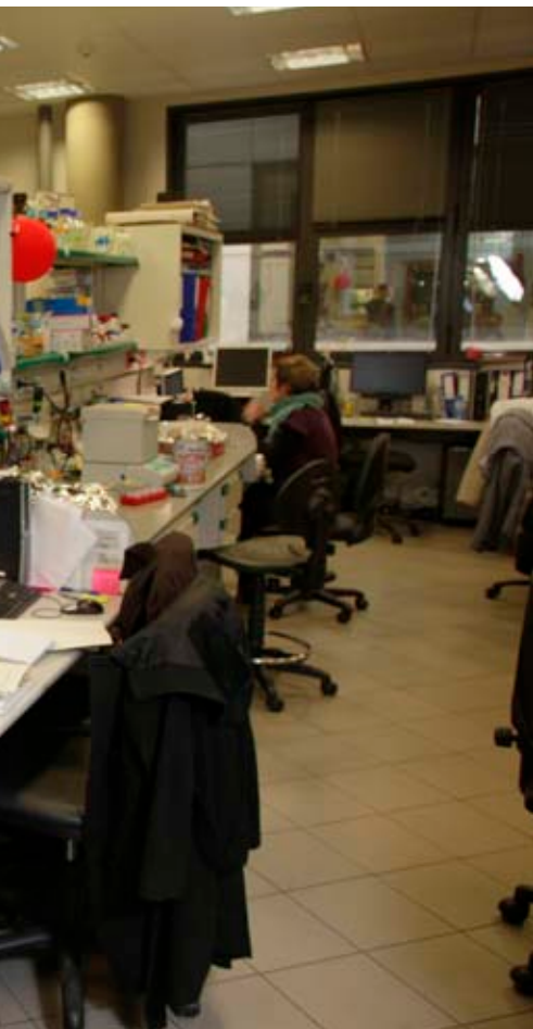
perd una cosa més preciosa: la credibilitat.”

dir que ha augmentat un grau i ha passat a ser d'alegre extermini. Quan els ha arribat una indicació assenyada en defensa d'algun petit centre de recerca de qualitat –amb una petita inversió, que no significaria res ni implicaria un estalvi que pugui ajudar ningú– han dit que no.