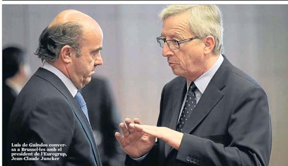
Luis de Guindos conversa a Brussel·les amb el president de l'Eurogrup, Jean-Claude Juncker

► El president anuncia avui més ajustos per complir l'objectiu de dèficit que vol Montoro ► El paquet inclou privatitzacions i noves taxes en l'ensenyament POLÍTICA 12 i 13