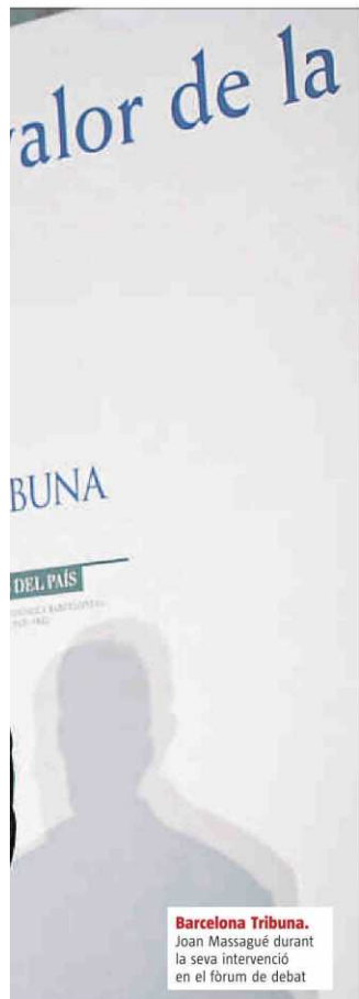
Barcelona Tribuna. Joan Massagué durant la seva intervenció en el fòrum de debat

MIREU LA INTERVENCIÓ DE JOAN MASSAGUÉ A www.lavanguardia.com/videos