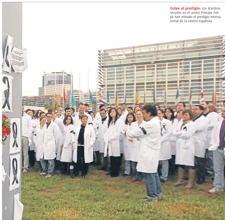
Golpe al prestigio. Los drásticos recortes en el centro Príncipe Felipe han minado el prestigio internacional de la ciencia española

Finalmente, se podrá optar a una plaza de investigador funcionario