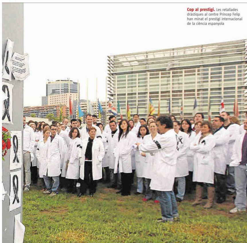
Cop al prestigi. Les retallades dràstiques al centre Príncep Felip han minat el prestigi internacional de la ciència espanyola

Finalment, es podrà optar a una plaça d'investigador funcionari